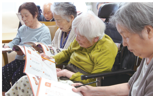
傾眠の傾向が強い方や徘徊の頻度が高い方も、授業形式のレクリエーションでは集中して取り組まれています。

「おとなの教科書」には、国語・算数・理科・社会など9科目と課外授業が用意され、話題が豊富。「教科書」という言葉は、難しいようにも聞こえますが、実際に授業形式のレクを受けてみると、皆様の思い出話を伺う内容となっているため、若かりしあの頃の